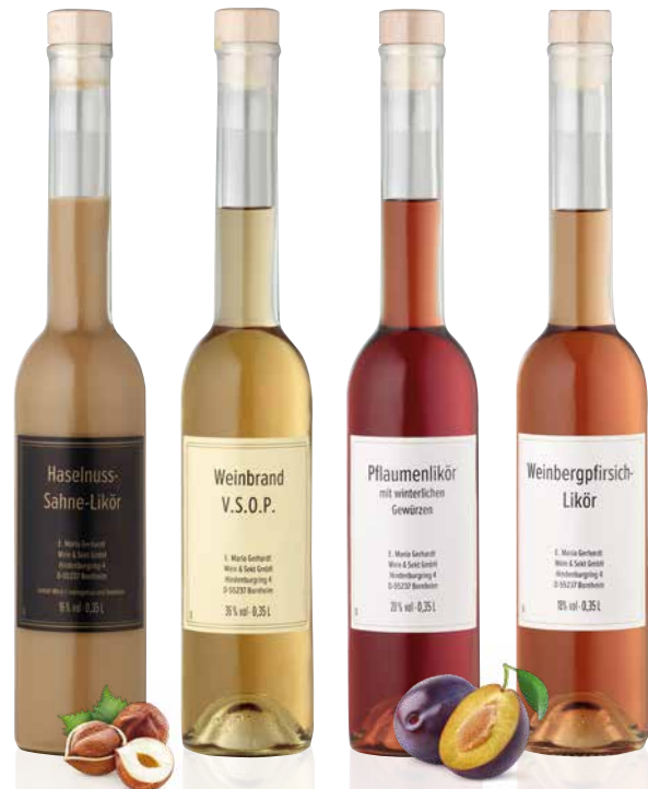
11 Haselnuss-Sahne-Likör (0,35 Liter) Art.-Nr.: B 3070 Schon seit der Antike gilt die braune Frucht des Haselstrauchs als Symbol für das Leben, die Liebe, das Glück und natürlich die Fruchtbarkeit. Die geniale Balance von leichter Süße, nussigen Aromen und cremiger Sahne verführen den Genießer.