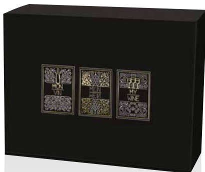
10 Weintrilogie Geschenkkarton Art.-Nr.: D 99867 2er Art.-Nr.: D 99868 3er