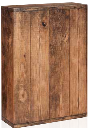
9 Vintage Geschenkkarton Art.-Nr.: D 99869 2er Art.-Nr.: D 99870 3er