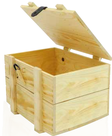
6 Holzkiste geflammt Holzkiste für 6 Flaschen Art.-Nr.: D 99820 6er