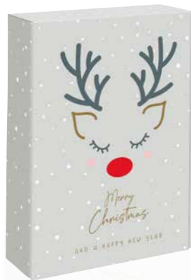
8 Red Nose Geschenkkarton Art.-Nr.: D 99920 2er Art.-Nr.: D 99921 3er