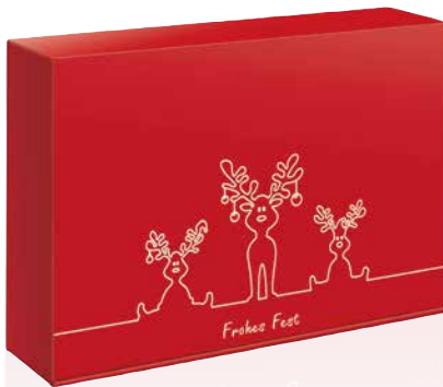
7 Rentier Trio Geschenkkarton Art.-Nr.: D 99933 2er Art.-Nr.: D 99934 3er